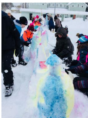
γλυπτική στον πάγο

Από τις 9:00 ως τις 12:00, οι ομάδες εναλλάξ πραγματοποίησαν δραστηριότητες θεάτρου, μουσικής και γλυπτικής στον πάγο. Κατόπιν έγινε γενική πρόβα των παρουσιάσεων που θα έκαναν το απόγευμα στο φεστιβάλ του χειμώνα, το οποίο πραγματοποιήθηκε παρουσία γονέων στις 6:00.